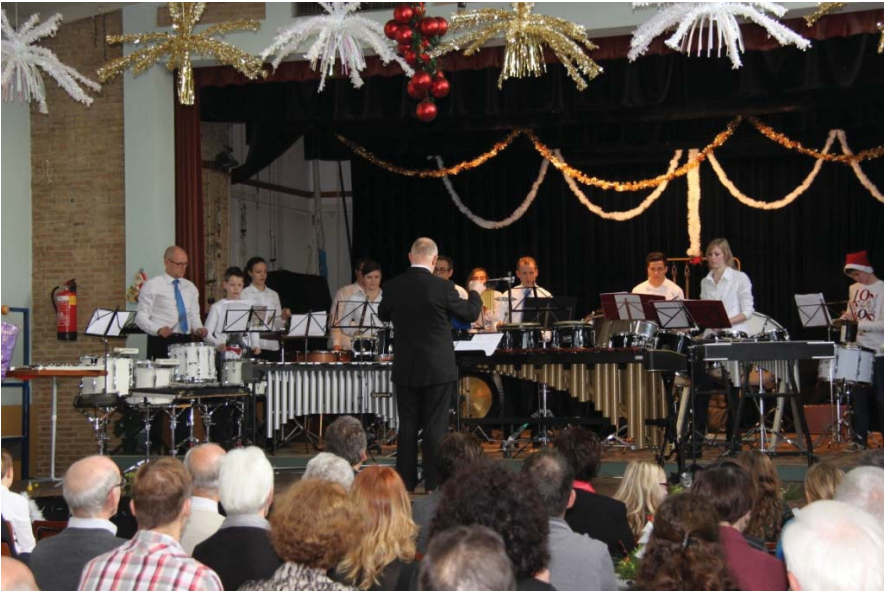
Het optreden van de tamboers was voor velen (positief) verrassend.