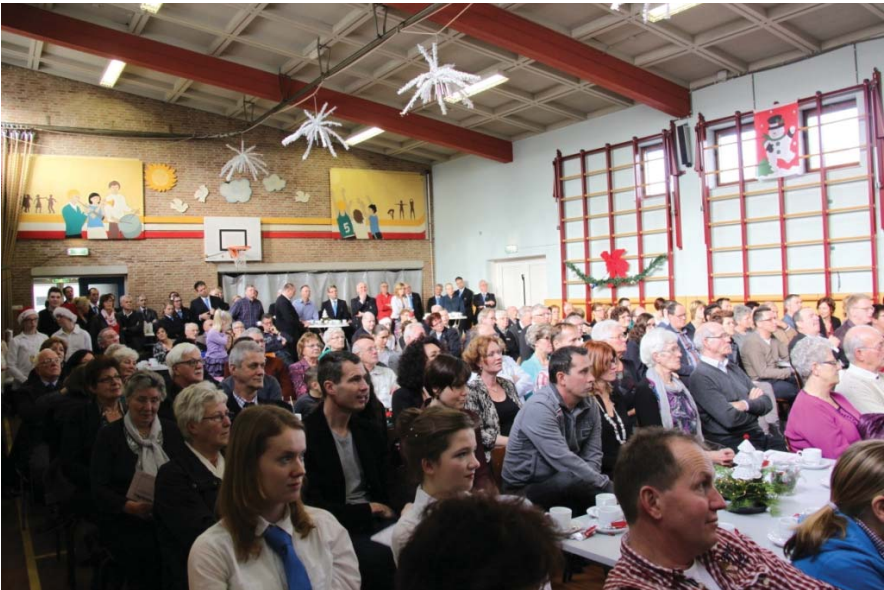
Het was behoorlijk druk in de grote zaal van 'De Vaart'.