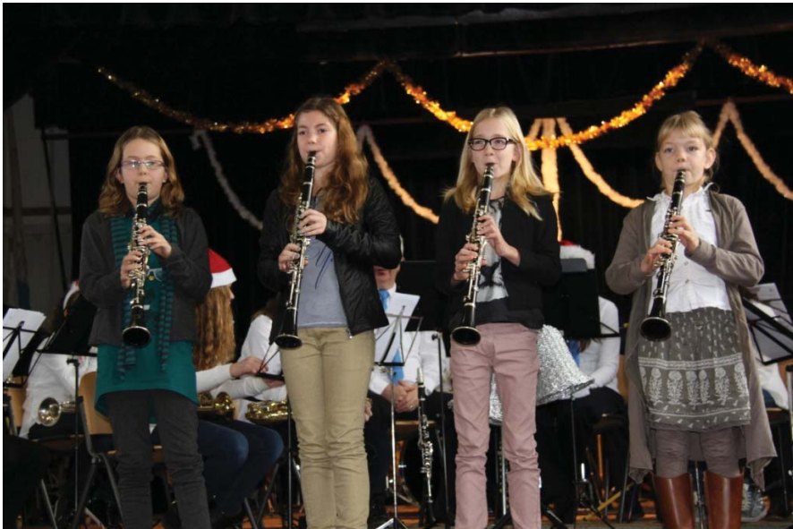
Een prima optreden van de klarinetleerlingen. Complimenten!